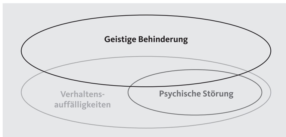
Abb. 1: Schematische Darstellung des Verhältnisses der Begriffe »geistige Behinderung«, »Verhaltensauffälligkeiten« und »psychische Störung«

Diese begriffliche Sichtweise kann indessen keine Verbindlichkeit beanspruchen. Denn in der Literatur zum Thema und im fachlichen Austausch in der Praxis trifft man durchaus auf andere Modelle. Besonderes Gewicht kommt dabei der ICD-10 zu (und bald ihrer Nachfolgerin, der ICD-11), der International Classification of Diseases (WHO 2016), an der sich vielfach die psychiatrische Diagnosestellung orientiert. Die ICD-10 lässt einen breiteren Begriff psychischer Störungen erkennen, als ihn Abbildung 1 skizziert. Er umfasst zum einen definierte psychiatrische Störungsbilder (auf die sich der Begriff psychische Störung in Abb. 1 beschränkt), wie z. B. Angst- und Zwangsstörungen, affektive Störungen (u. a. die Depression) oder Essstörungen. Zum andern gilt zusätzlich auch die Intelligenzminderung (d. h. geistige Behinderung) als psychische Störung. Von einer Verhaltensstörung ist gemäß ICD-10 als psychiatrische Ausschlussdiagnose zu reden, d. h. wenn sich Auffälligkeiten im Verhalten eines Menschen keinem der definierten Störungsbilder zuordnen lassen (siehe hierzu weiterführend Schanze 2014, S. 235 f.).